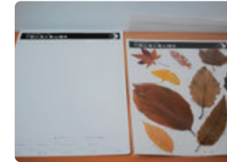
専用シート(左)、完成品(右)