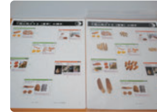
専用シート(左)、完成品(右)