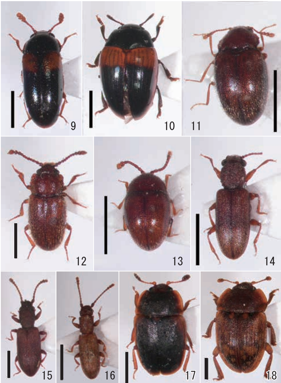
図1. 山口県で採集した甲虫類 (2)

9 カクモンホソオオキノコ；10 カクモンチビオオキノコ；11 ヒラムネマルキシイ；12 コヤシキシイ；13 フタフシセマルキシイ；14 マルムネホソヒラタムシ；15 ブナホソヒラタムシ；16 ホホビロホソヒラタムシ；17 セグロヒラタケシキシイ；18 ヒメアカマダラケシキシイ ※スケールは1mm.