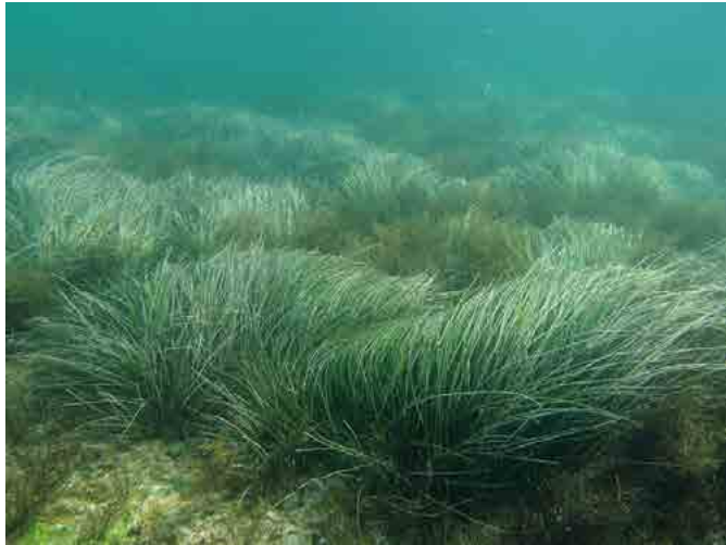
図 2. 角島（大浜）の群生の様子

エビアマモと同定した。今回確認できた地域はいずれも日本海側の波浪にさらされる岩礁上であった(図1)。阿川及び通瀬岬はわずか数株の確認で小規模な生息地であったが最も波浪の影響があると考えられる大浜では群生していた(図2)。これまでに三隅町と萩市から分布記録があることから山口県内では豊北町角島から萩市田万にかけての沿岸部で新たに生息地が見つかる可能性があると考えられる。