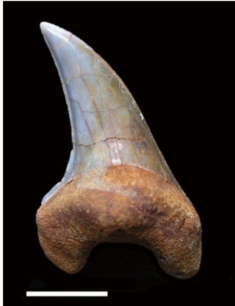
図 2. Parotodus benedeni の歯の化石 ※スケールは 1cm