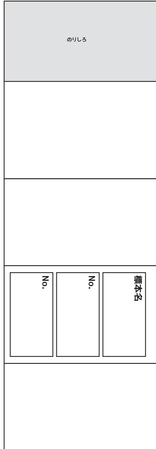
標本箱を収納する箱